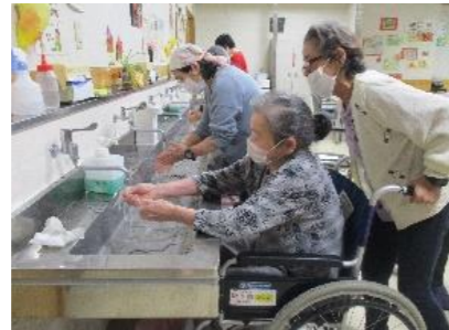
入念に洗っています