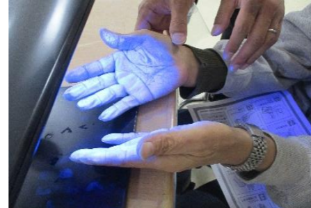
洗い残しは青黒く発光！！